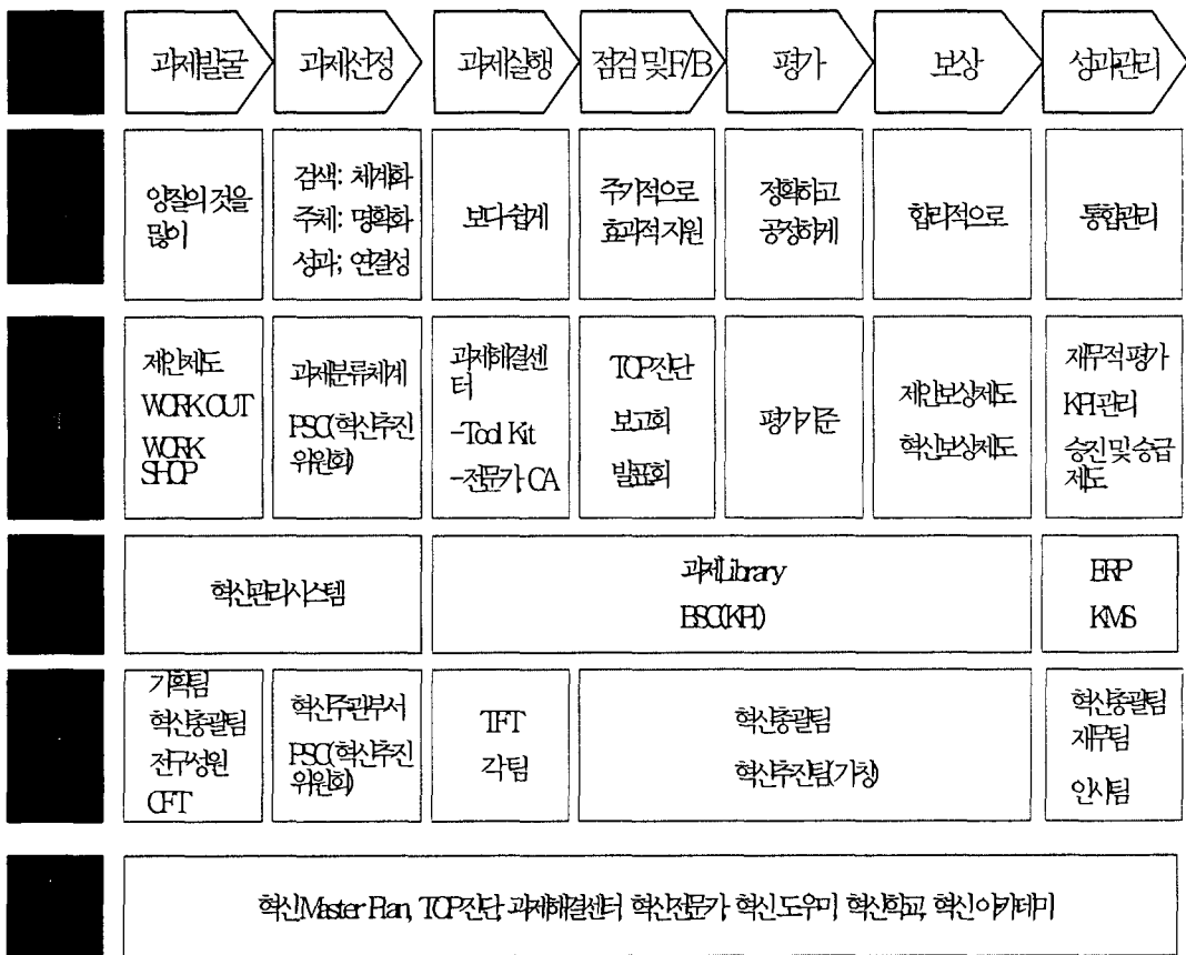
<그림 2> TIM의 관리 Process

또한 ERP와 KMS를 통한 재무적 평가와 KPI관리, 승진 및 승급제도의 효율화와 각 부서 및 팀별 조직 효율화를 도모한다.