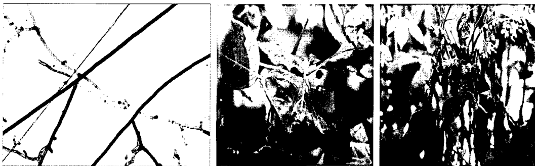
Fig. 4. Leaf blight of Eleutherococcus senticosus caused by Rhizoctonia solani : Micrographs of R. solani (left), early symptoms (center) and late symptoms (right) of leaf blight.

a : Mycelial growth was measured after the incubation of 2 days for Rhizoctonia solani , and 3 days for Phoma sp. and Botrytis cinerea .