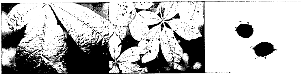
Fig. 2. Black ring spot of Eleutherococcus senticosus caused by Phoma sp.: Leaf symptoms of black ring spot (left and center) and Micrographs of Phoma sp. (right).