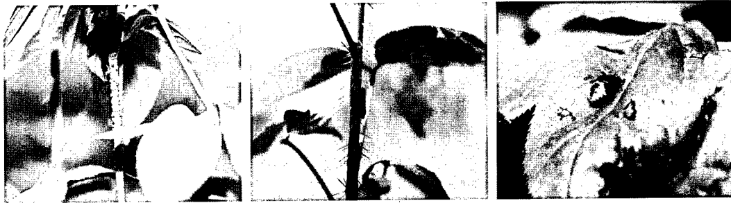
Fig. 1. Insect pests identified on Eleutherococcus senticosus cultivated field: Aphids injury on shoot (left), Suction of Bothrogonia japonica (center) and nymphs of stinkbugs (right).

검은무늬병은 잎에 초기에 황갈색의 반점이 생겨 점차 흑갈색의 괴사반점으로 변하는 특징을 나타냈다. 특이한 점은 가시오갈피 수집지역별 개체에 따라 병징의 형태와 피해 정도가 다양하게 나타났는데(Fig. 2, 좌측과 중앙), 이는 각 개체의 저항성 정도에 따라 다양한 병징을 보이는 것으로 생각되었다. 가시오갈피의 괴사반점의 이병진전상태를 알기 위하여 병징을