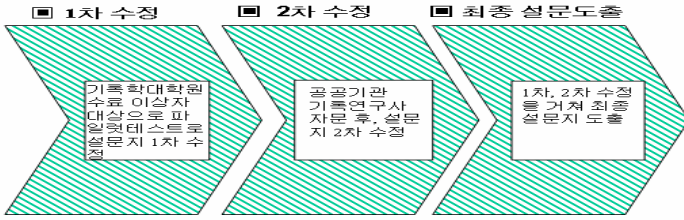
<그림 3> 평가기준표 설계과정

또한 기준표의 평가 척도의 방법으로서는 구조와 디자인, 콘텐츠, 인터페이스, 커뮤니케이션, 검색 5개의 평가부문에의 각 문항을 평가한 평균점을 평가영역별, 평가문항별로 나누어 분석하였다.