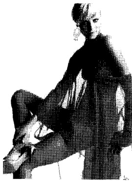
<그림 8> 수영복 마리끌레르, 2004/06

에로틱함과 동시에 연출하기도 하고<그림 9> 25) , 심플한 골프웨어에 믹스된 시스루 역시 기능성과 함께 에로틱함을 연출하였다 <그림 10> 26) . 몸의 움직임 많은 댄스 웨어는 몸에 밀착된 망사소재로 활동성과 함께 에로틱함을 나타내었다<그림 11> 27) .