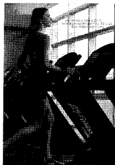
<그림 14> Exercise wear 뱅생강 한국판, 2003/4