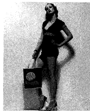
<그림 1> 테니스 웨어