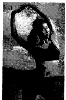
<그림 15> 에어로빅 웨어 ELLE, 2005/4