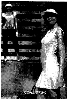
<그림 10> 골프 웨어 http://news.naver.com/news

밀착을 통한 방법은 에어로빅 같은 타이트한 복장을 하는 스포츠웨어에서 찾아 볼 수 있었는데, 1980년대 여성들 사이에 유행되기 시작한 에어로빅이 체중조절을 위한 운동이 되었고, 운동 시 입는 레오타드는 몸에 밀착되어 여성의 신체 곡선을 그대로 드러나게 하였다. 이 외에도 니트를 소재로 신체에 밀착시켜 여성적인 아름다움을 나타내는 스포츠웨어는 일상복으로도 널리 사용되고 있었다.