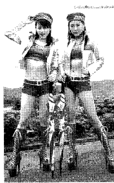
<그림 5> 레이싱 웨어 http://www.naver.com