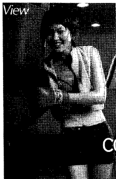
<그림 3> 복싱 웨어 Vogue, 2003/6

또한 <그림 5> 21) 의 레이싱 웨어(racing wear)는 무기력한 일상에서 탈피하여 빠른 속도를 맛보고 싶어