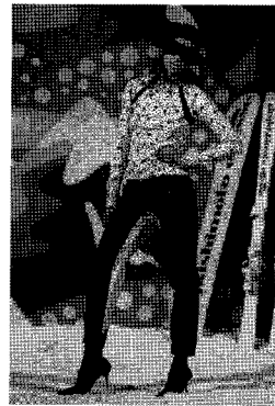
<그림 12> 스키 웨어 http://www.cft.or.kr

바쁜 일상 속에서도 여유를 잃지 않고 자신을 위해 시간을 투자하는 당찬 여성상을 나타내는 또 다른 액세서이즈 스포츠웨어도 탄력적인 몸매를 타이트한