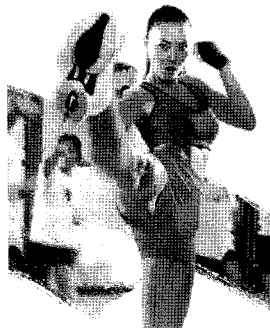
<그림 4> 킥복싱 웨어 Vogue girl, 2004/10