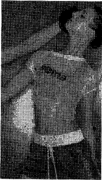
<그림 7> 복싱 웨어 Weekly Fashion, 2003/11