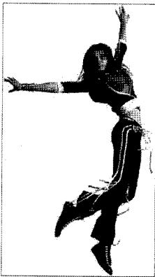
<그림 9> Exercise wear

에로틱함과 동시에 연출하기도 하고<그림 9> 25) , 심플한 골프웨어에 믹스된 시스루 역시 기능성과 함께 에로틱함을 연출하였다 <그림 10> 26) . 몸의 움직임 많은 댄스 웨어는 몸에 밀착된 망사소재로 활동성과 함께 에로틱함을 나타내었다<그림 11> 27) .