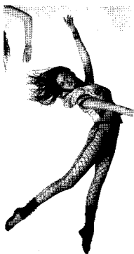
<그림 11> 댄싱 웨어 Vogue girl, 2004/1