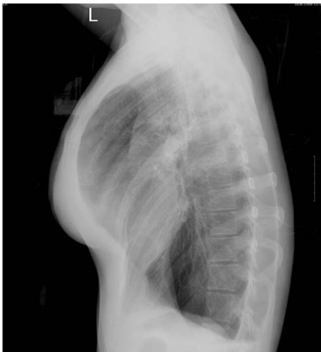
Fig. 4. Obstructive lung disease due to bronchiolitis obliterans in cGVHD.

이식 전 예방접종의 효과는 이식 후 4년 동안 서서히 감소하나 약 2년 후에는 예방능력이 없을 정도로 낮아진다. 따라서 이식 후 1년 후에는 재 예방접종을 하는 것이 좋다 41, 42) . 그러나 생백신에 의한 예방접종은 안된다. 여러 가지로 아직 정립되지는 않았으나 가이드라인은 Table 7과 같다.