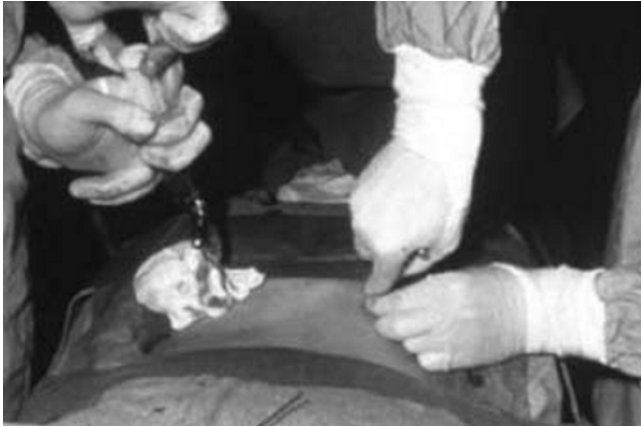
Fig. 1. Bone marrow harvest from iliac crest.

순환되며 이를 백혈구분반술을 이용하여 채취한다. 말초 혈액 모세포의 이용은(blood stem cell transplants) 골수모세포보다(marrow stem cell transplants) 이식 후 중성구와 혈소판의 회복이 빠르다 2,3) . 제대혈을 출산 시 채취하여 같은 목적으로 사용하기도 한다 4,5) .