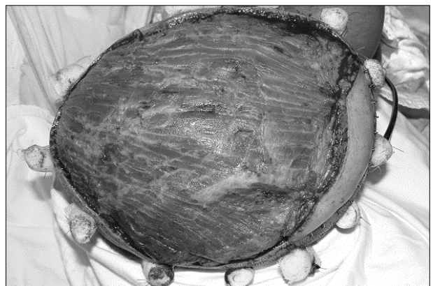
Fig. 5. LD muscle free flap was transferred to recipient site.

혈관육종은 혈관의 내피세포에 기원하는 드문 악성종양으로 임상적으로 4가지 유형으로 나눌 수 있는데, 노인의 두피와 안면에 발생하는 혈관육종, 만성 림프부종에 이차적으로 생기는 혈관육종, 다량의 방사선 조사후 생기는 혈관육종 및 악성 증식성 혈관내피세포종 등으로 분류된다. 두피와 안면에 발생하는 혈관육종이 가장 흔하며, 노인층에 잘 발생하며 남자에서 약간 더 빈도가 높고 안면보다는 두피에서 더욱 호발하는 것으로 알려져 있다 5) . 혈관육종을 가진 환자를 치료하는 모든 의사들의 공통된 문제는 수술장에서 종양의 전체 범위를 결정할 수 없다는 데 있다 6) . 저자들은 절제부의 경계에 대한 동결절편분석만으로는 절제가 불완전하다고 생각하는 데, 이것은 동결절편분석에 요구되는 조직처리에 있어서 왜곡을 보이기 때문이다. 혈관육종 세포