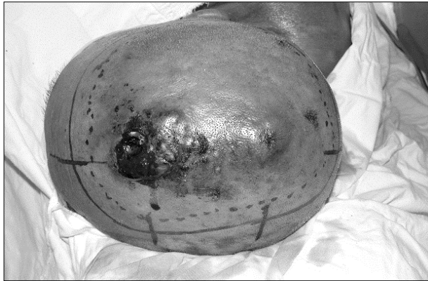
Fig. 3. Preoperative mapping biopsy were performed circumferentially with at least 2cm margin around erythematous lesion to determine the true extent of the neoplasm.

72세 남자 환자로 1년전 전두부에서 발생한 종양을 주소로 내원하였다. 피부과 의원에서 치료하였으나, 호전되지 않아 본원 피부과에서 amyloidosis, lichen simplex chronicus 의심하에 조직검사후 혈관육종으로 판명되어, 본원 성형외과로 전원되었다. 외과적 절제 범위를 종양의 경계로부터 2cm로 정하고, 5군데에서 multiple mapping biopsy 시행하였으며, 1곳에서 양성으로 보여, 추가로 1.5cm밖에서 종양절제를 추가 했다. 광범위 절제술과 광배근 유리피판술 그리고 분층 피부이식술을 시행했으며, 방사선 치료(63Gy)를