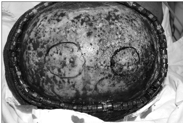
Fig. 4. Wide excision.