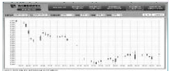
(그림 2. 돈육 대표가격 기간별 봉그래프 공시화면)