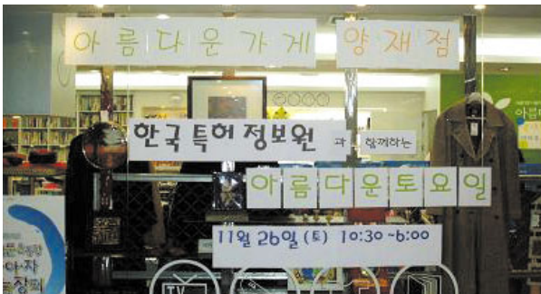
지난 해 11월 26일 토요일 한국특허정보원 사회봉사단은 '아름다운 가게' 양재