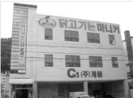
(주)마니커(대표이사 한형석)는 지난 7월 12일 한형