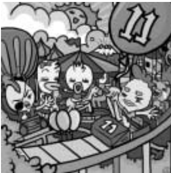
〈숨은 그림 : 야구방망이, 고추, 연필, 종이배, 부엌칼, 삼각자, 바섯, 머리빗〉

본회에서 발간하는 '월간 닭고기'가 2006년 7월로 창간 11주년을 맞이하여 이를 기념코자 '숨은 그림 찾고! 상품 받고!' 지면 이벤트를 진행한다.