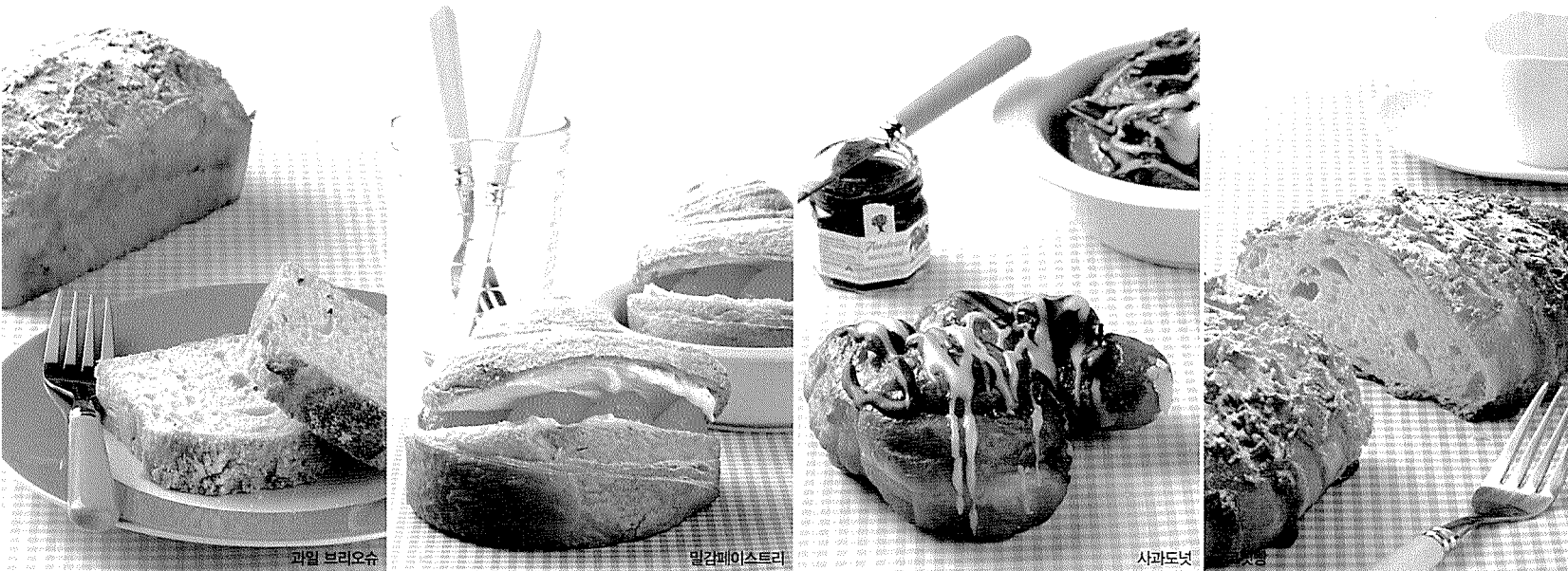
'과일 브리오슈'는 오렌지ピール, 코코넛 등 향이 진하고 독특한 과일을 넣은 반죽을 구워 깊은 향과 맛을 느낄 수 있다. 인근 회원들에게 간식으로 인기가 높다. '밀감페이스트리'는 결이 살아있는 페이스트리에 달콤한 프레쉬 크림과 상큼한 밀감을 샌드했다. 상큼한 사과를 넣어 만든 도넛 반죽에 달콤한 초콜릿을 코팅한 '사과도넛'은 어린이들에게 특히 인기가 높다. '코코넛빵'은 코코넛을 넣어 독특한 맛을 지닌 반죽에 달콤한 코코넛 크림을 겹겹이 샌드해 맛이 진하다.

물 대신 직접 만든 딸기소스를 넣어 반죽한 빵에 한 달 동안 설탕에 재워 둔 딸기를 통째로 넣어 만든 딸기 브레드는 딸기 특유의 상큼한 맛이 고스란히 살아있다. 재료의 맛을 최대한 살리기 위해서라면 까다로운 공정도 마다하지 않는 오너 셰프의 철저한 장인정신이 살아있는 인기 제품을 모아 소개한다. 진행_박소희 기자·사진_주현진