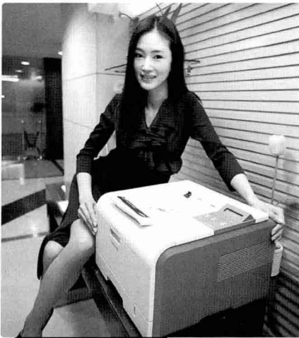
삼성전자, 중소 사무실용 레이저프린터