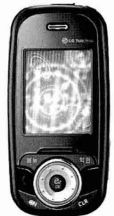
LGT '기분ZONE' 지원 폰

한 손에 쏙 들어오는 컴팩트 한 사이즈에 반자동 슬라이드 디자인으로 휴대성과 사용 편의성 또한 대폭 강화했다. 아울러 화질 보정을 지원하는 130만화소 메가픽셀 카메라를 탑재했으며, 렌즈를 보호하는 카메라 덮개를 채용해 덮개를 위로 살짝 올리면 바로 촬영이 가능하고 닫으면 신속하고 빠르게 촬영을 마칠 수 있다.