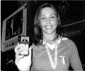
LG전자, 유럽향 모바일TV 'DVB-H폰'