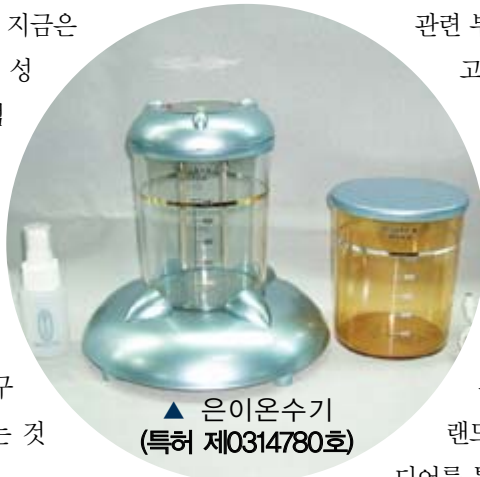
▲ 은이온수기 (특허 제0314780호)

현재 대부분의 전문가들이 지금은 국내 매트 및 의료기기시장은 성숙기를 이미 지나고 있는 시점으로 생각하고 있으나, 우리 국민의 주거문화상 매트 등의 가정용 의료기기의 재구매 현상은 시간을 거듭할수록 더욱 강해질 것으로 예상되고 있으며, 서광의 개발연구에 대한 투자가 증가세에 있는 것은 이러한 예측과 연관이 있다.