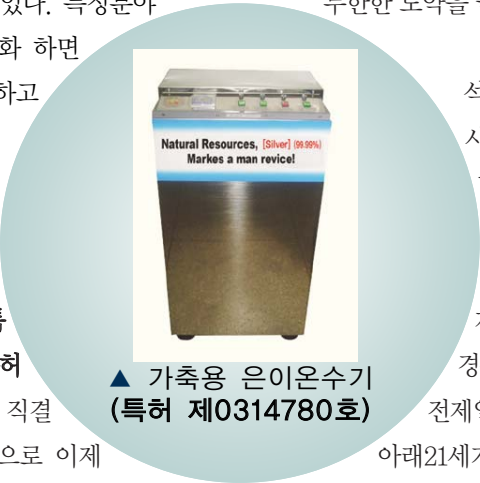
▲ 가축용 은이온수기 (특허 제 0314780호)

업관리로 안정된 바탕위에 이제는 꾸준한 성장세를 타기 시작했다. 그리고 이제는 무한한 경쟁시대에 무한한 도약을 꿈꾸고 있다.