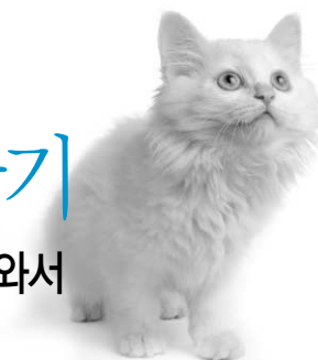
이미경 (캣츠앤독스 동물병원장)

Hill's Global Symposium on Feline care를 다녀와서