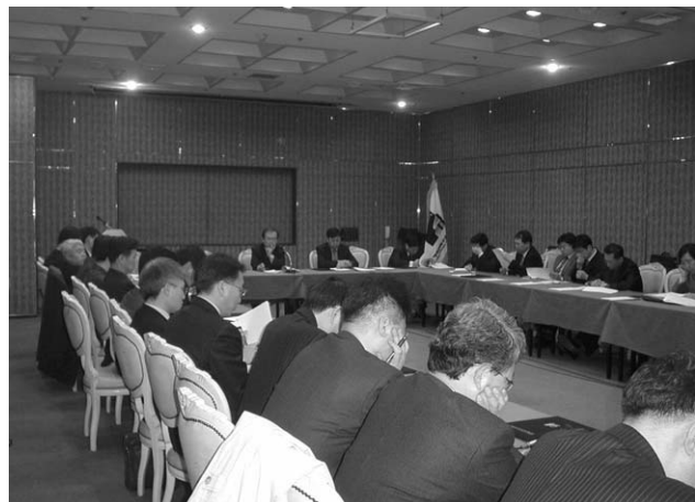
〈2006년 1차 이사회 사진〉