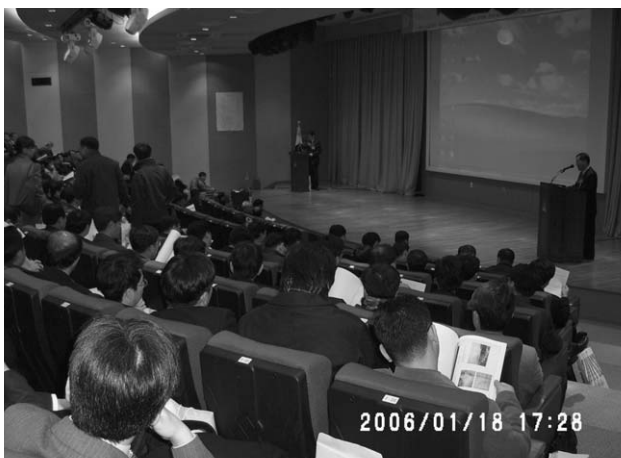
<2006년 기술세미나 전경>