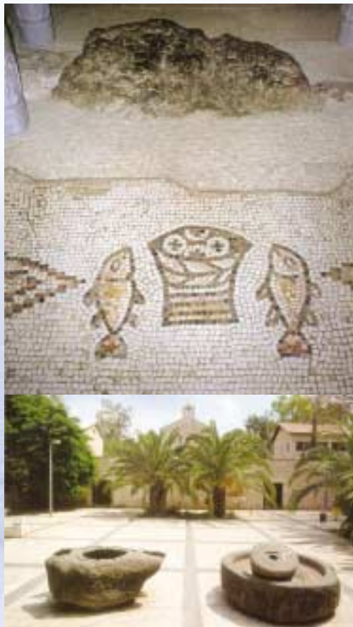
빵의 기적 성전

예수께서 빵 다섯 개와 물고기 두 마리로 5천 명의 군중을 배불리 먹으셨다는 자리에 기념 성전을 세웠다. 1982년 비잔틴 양식으로 독일 베네딕도 수도회 소속이다(관련성서 : 마르 6,30-44; 마태 14,13-21; 루가 9,10-17; 요한 6,1-15).