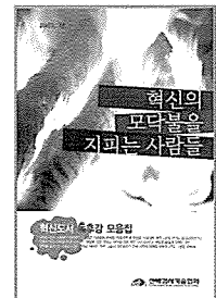
혁신도서 독후감 모음집

선박검사기술협회는 혁신내재화 및 혁신학습 성과 창출의 일환으로 작년에 협회 직원들이 발표한 총30권에 대한 혁신도서 독후감이 수록된 “혁신도서 독후감 모음집”을 발간하였다. 이번에 발간된 모음집은 “혁신의 모닥불을 지피는 사람들”이라는 부제로 혁신학습 토론회, 혁신선도팀, 혁신아카데미 등에서 리더십, 자기경영 등 다양한 주제를 가지고 토론한 발표자료를 기초로 작성하였으며, 동 모음집은 ▲자기경영 ▲변화관리 ▲팀·리더십 ▲경영혁신·고객만족 ▲현재와 미래 등 총 5개 분야로 구성되었다. 협회는 이번 모음집 발간으로 전직원이 함께 참여하는 혁신도서 독서노력을 통해 지속적인 혁신학습 기반을 갖춘 혁신 잘하는 기관으로 도약할 것으로 기대된다.