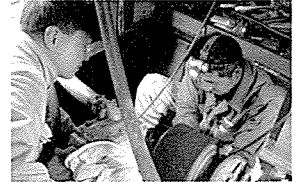
- 어선기관 무료 안전점검 중 -

협회는 앞으로도 고객편의 제공 및 해양사고 예방을 위하여 정례적으로 무료안전점검을 실시할 예정이다.