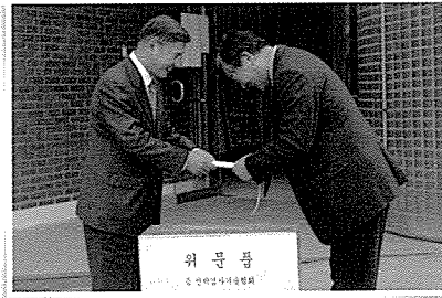
- 사회복지성금 전달 -