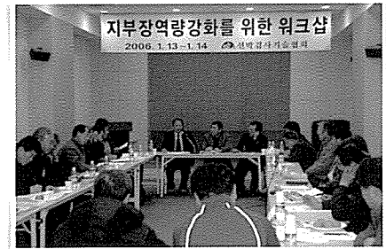
- 고객관계관리 강화관련 케이스 스터디 -