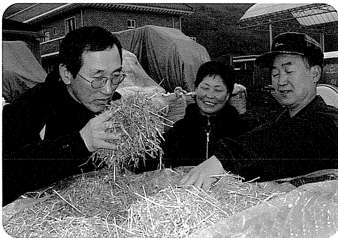
▲ ‘밀크피드’로 발효시킨 TMR사료