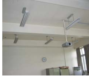
▶▶ GHP 냉난방 실내기(변경전후)