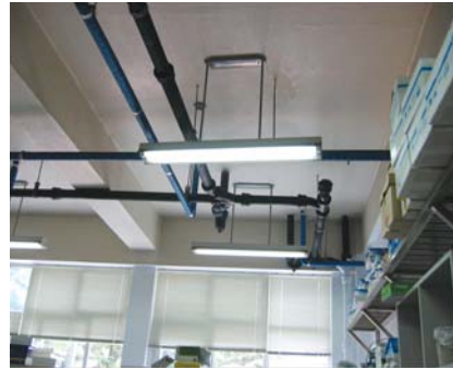
▲ 부산대 전등설치(변경전)

“현재 중소기업 지원을 강화하기 위해 정부자금을 가이드라인으로 정했는데 그것보다 프로젝트에 따라 가이드라인을 정해야 한다고 봅니다. 사업자금, 수행능력에 따라 나누는 것이지요. 고객들 중에서는 믿을 수 있는 기업이라는 신뢰도를 중요시하는 고객들도 많이 있습니다. 그래야 중도하차하는 ESCO사업이 적어질 것입니다. 대형 프로젝트가 ESCO시장에서도 활성화되기 위해서는 투자여건을 형성해줘야 한다고 봅니다.”