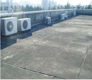
▶▶ 부산대 GHP 냉난방 실외기(변경전후)