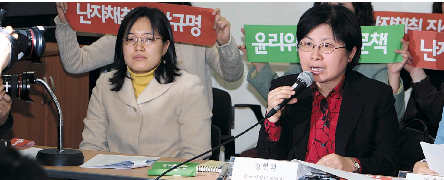
지난 1월 4일 한국여성민우회 등 전국 35개 여성단체 대표들이 서울 프레스센터 7층 환경재단 레이첼카스룸에서 황우석 교수팀의 배아줄기 세포 연구와 관련된 '난자채취 과정 진상규명을 위한 공동 기자회견'에서 난자 사용으로 윤리문제가 야기되는 배아복제 연구에 대한 근본적 재검토 등을 촉구하고 있다.

않았다. 심지어 2004년 황 교수팀이 연구에 성공했을 당시에는, '여성의 난자와 체세포'만을 사용하므로 도덕적 문제가 없다는 보도까지 있었다.