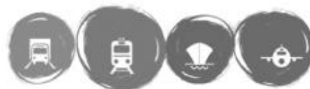
UNESCAP Ministerial Conference on Transport 2006