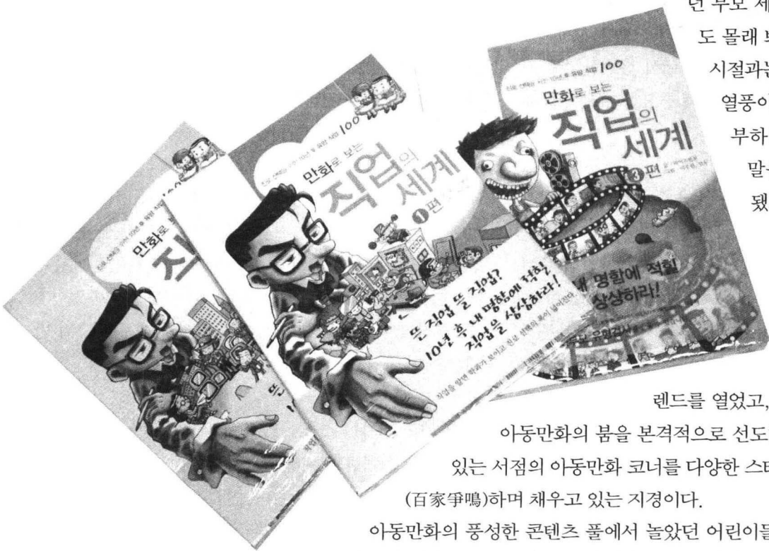
만화로 보는 직업의 세계 10년째 시리즈 (동아일보사) 1994년 창간 10주년

이러한 환경 때문인지, 1318을 겨냥한 본격적인 청소년 만화를 찾기 어렵다. 그러나 지식·문화콘텐츠를 다루는 출판 시장에서는 장애물을 오히려 발판으로 삼는 발상의 전환이 충분히 가능하다. 학생들 스스로 자신의 진로를 찾도록 친절하게 도와주는 《만화로 보는 직업의 세계》(이하 《직업의 세계》, 동아일보사)