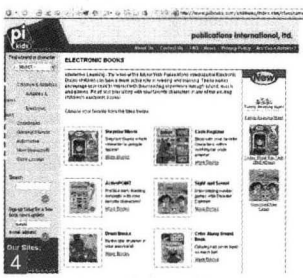
1. P에서 발행하고 있는 스토리 리더 북 2~4. 새로운 테크놀로지를 결합한 책을 판매하고 있는 업체의 사이트들.

국의 사회적 분위기와 더불어 디지털 테크놀로지와의 접목으로 그 입지를 넓히고 있다. 우선 미국의 독서 분위기를 살펴보면 점차 많은 미국인들이 한가로이 앉아서 책을 읽을 시간을 빼앗기고 있다. 9,700만을 넘는 사람들이 매일 일을 하기 위해 혼자 차를 운전하고 있고 교통정체는 해가 바뀔수록 그 수위가 높아져만 가고 있다. 여기에 운동, 정원 가꾸기, 요리 등으로 사람들은 점점 더 책을 볼 시간을 줄이고 있지만 오히려 무언가 들을 수 있는 기회는 더 많아지고 있다. 이러한 사회적 환경 변화에서 디지털 다운로드의 돌풍을 몰고 온 아이포드, 각종 첨단 기능을 가진 휴대폰, MP3 그리고 위성 라디오의 수요는 책도 음악처럼 다운로드로 들을 수 있는 환경을 제공했다. 그러자 많은 출판사들과 관련업계들은 디지털 다운로드를 포함한 오디오북 시장에 서둘러 진출하고 있다.