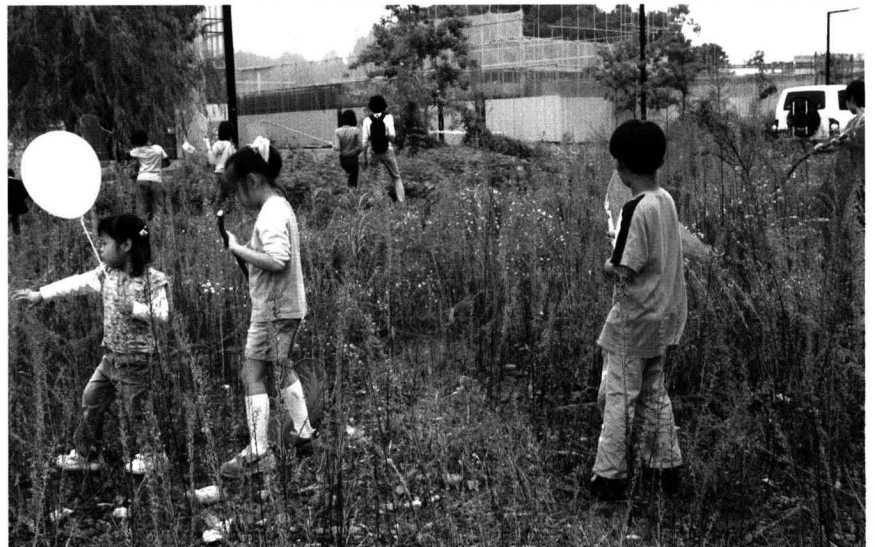
파주출판도시 어린이 책잔치는 올해로 4회 째를 맞는다. 150여 입주사 가운데 어린이 도서 전문 출판사 45개 업체가 참여하는 대규모 행사다

행사기간 동안 파주 출판단지는 '차없는 거리'로 바뀐다. 생태도시를 표방해 환경 조성을 진행해 온 파주출판문화 단지는 도시에서 쉽게 볼 수 없는 갈대밭과 각종 곤충류가 서식하고 있어 어린이 자연학습의 장으로도 이용 가능하다. 건축작품으로도 손색없는 출판사의 사옥을 최대한 개방, 활용하여 열리는 이번 책잔치에는 책을 멀리하는 어린이들에게 책을 '체험'하고 보다 가까이 할 수 있도록 하는 계기가 될 것으로 기대한다. 참여객이 몰리는 주말을 피해 홈페이지에서 출판사별 일정을 확인한 후 참여하면 보다 알찬 책 잔치를 즐길 수 있다.(문의 : 031-955-0063) ☎