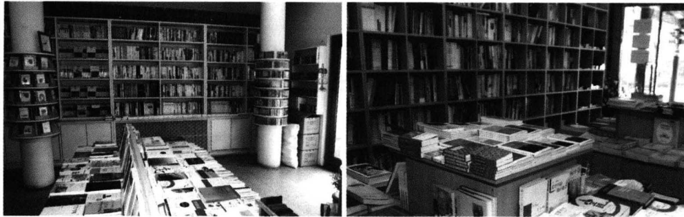
불일서점(좌) 봉은서원(우) 내부 전경

불교서점으로서의 불일서점의 특징은 중앙의 진열대에서부터 드러난다. 법정이나 틱낫한 스님의 책 같은 일반인에게 익숙한 스테디셀러는 물론이고 《금강경》《법구경》같은 경전까지, 좁다면 좁달 수 있는 규모이지만 불교에 관한 서적은 대중화된 서적부터 전문서적까지 골고루 구비되어 있다.