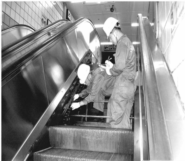
서울메트로 에스컬레이터 안전진단 장면.

한국승강기안전관리원(원장 유대운·이하 승관원)은 지하철 2호선 사당역과 총정로역, 독립문역, 경복궁역, 안국역,고속터미널역, 충무로역 등 7개 역사에 설치·운영 중인 46대의 에스컬레이터에 대한 안전진단을 다음달인 9월 15일까지 실시한다고 밝혔다.