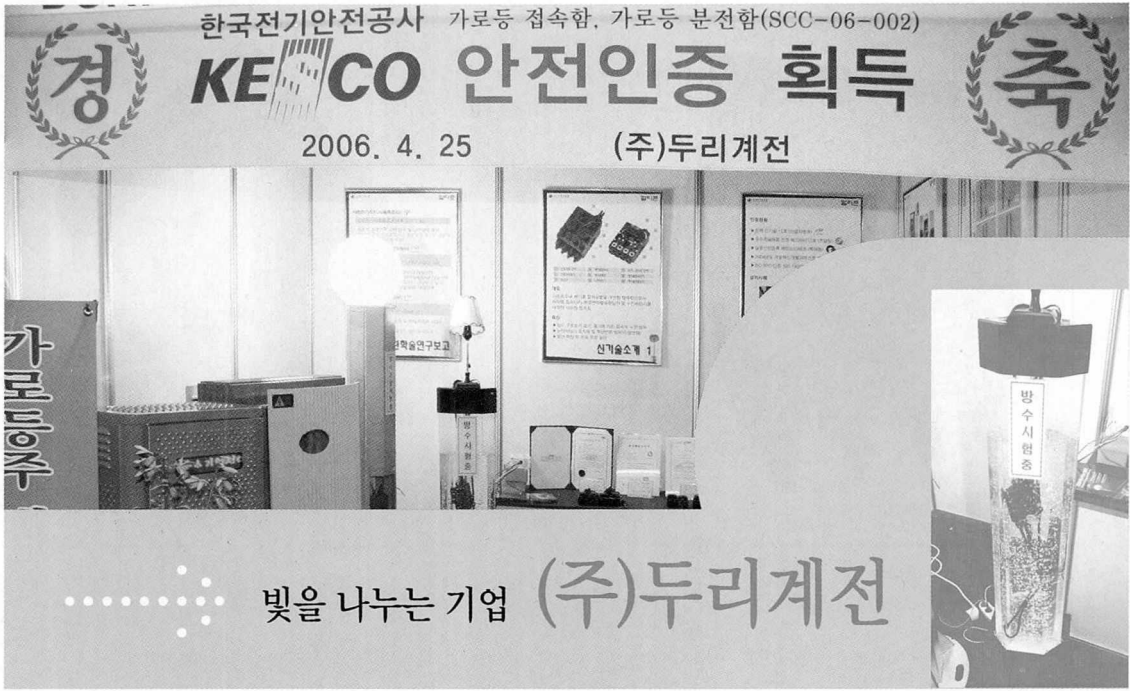
※ 다기능 접속함 방수시험중

(주)두리계전의 경영이념은 “최선, 최고”이다. 고객을 최우선에 두고 최고의 품질과 최상의 서비스를 제공하여 최적의 환경에서 인간다운 삶을 영위할 수 있도록 최선의 노력을 경주하며, 인간 중심의 경영을 통한 복지 사회 건설에 앞장서기 위해, 꾸준한 기술 개발로 안전환경을 조성하는데 최선을 다하겠다는 것이 (주)두리계전의 경영이념이다.