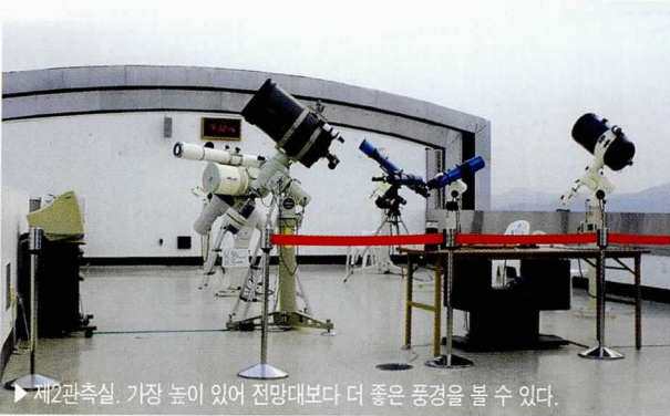
▶ 제2관측실. 가장 높고 있어 전망대보다 더 좋은 풍경을 볼 수 있다.