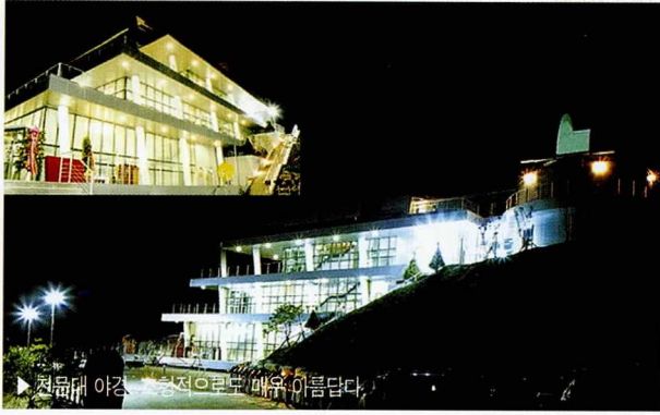
▶ 천문대 야경. 등적으로부터 매우 아름답다.