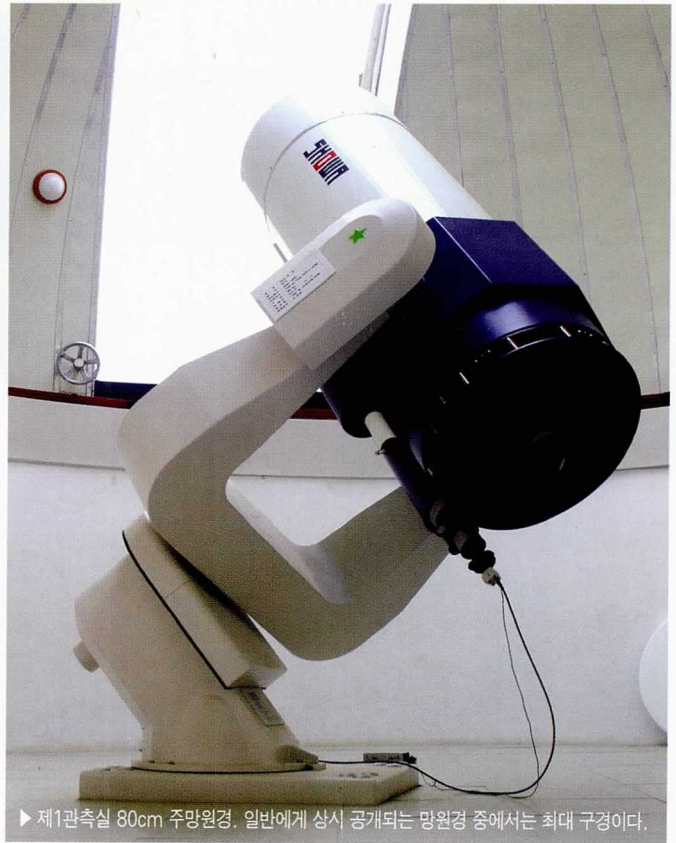
▶ 제1관측실 80cm 주망원경. 일반에게 상시 공개되는 망원경 중에서는 최대 구경이다.