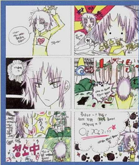
♥ 숲관련 만화그리기 주제 - 숲이 하는 일