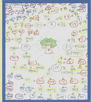
♥ 숲관련 마인드맵