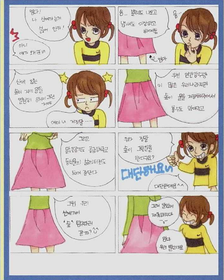
♥ 숲관련만화그리기 주제 - 숲이 하는 일