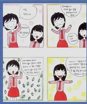
♥ 숲관련 만화그리기 주제 - 숲이 하는 일