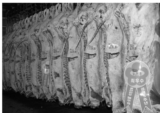
늘푸름 홍천한우 브랜드