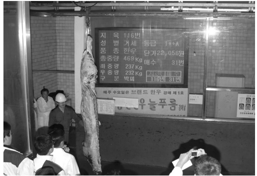
고급육품평회 최우수축 경매

평회에서는 최용순(흥천군 남면)씨가 출품한 도체번호 116번(경락단가 22,056원/도체중 469kg)이 1++A등급(989점)으로 근내지방도 No. 9, 등지방두께 0.8cm, 등심단면적 96cm 2 로 다른 고급육 생산농가에 비해 육질과 육량등급 모두 우수하여 최우수농가에 선정되었으며, 또 허남수(흥천군 동면)씨가 출품한 도축번호 118번(경락단가 20,950원/도체중 423kg) 역시 1++A등급(988점)으로 근내지방도 No. 9, 등지방두께 1cm, 등심단면적 98cm 2 의 성적을 나타내 우수농가에 선정되었다. 특히 출품우 15두의 등급 판정 결과 육질 1++등급이 8두(53.3%), 1+등급이 7두(46.7%)였고, 육량A등급은 6두(40%), B등급 8두(53.3%)로 우리나라 대표 브랜드답게 매우 높은 고급육 출현율을 나타냈다.