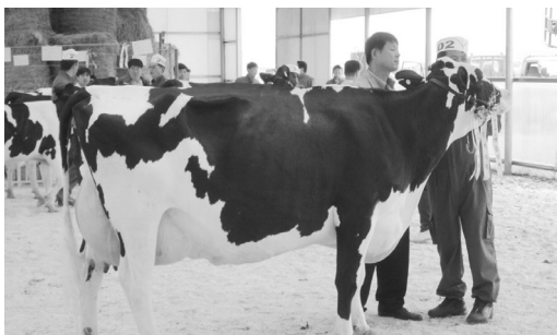
<그림 5> 제1회 챔피언 모습(새벽 78호)