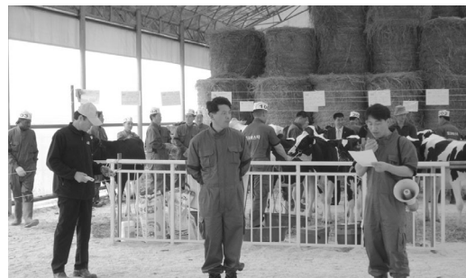
<그림 2> 식전행사를 생략한 오늘의 행사소개