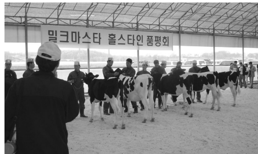
<그림 4> 미경산우 심사모습