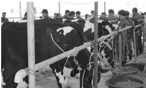
<그림 1> 회원들이 손수 만든 계류장, 아침부터 출품준비로 분주한 회원들

을 같이한 지역 선후배 사이로 개량에 대해 공부도 같이 하며 낙농의 꿈을 함께 하여 왔다. 이번 행사를 계기로 개량동우회 차원의 지역품평회가 더 많이 활성화되기를 기대해 본다.