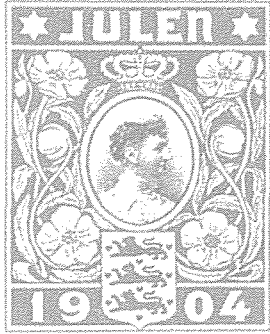
세계 최초의 크리스마스 스티

있는 작은 징표를 함께 붙인다면 그 기금으로 결핵을 물리칠 수 있겠다는 생각을 했던 것이다. 그의 아이디어는 큰 호응을 얻었고, 나중에는 국왕의 적극적인 협조하에 기금을 모금하였는데 그 기금은 소아결핵사나토륨을 건립하는 등 결핵 퇴치활동에 소중한 밑거름이 되었다.