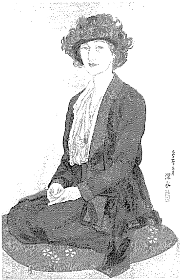
1922년 그려진 엘리자베스 키스의 초상화

한국에 대한 애정어린 시선, 그래서인지 그는 '기탁'이란 한국이름을 갖고 있기도 하다.