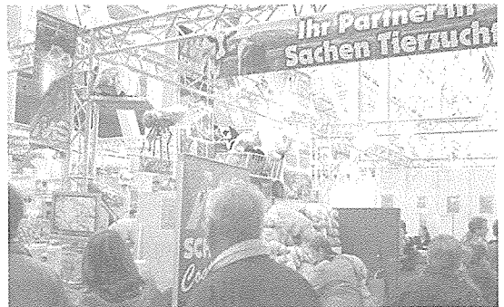
▲ 지난 11월 14~17일 독일 하노버에서 개최된 국제축산박람회(2006 EuroTier) 모습.

한국국제축산박람회(KISTOCK) 공동주관단체장들이 지난 11월 14일부터 17일까지 독일 하노버에서 열린 국제축산박람회(2006 EuroTier)에 참석해, 내년에 대전에서 개최되는 한국국제박람회 유치활동을 전개하고 지난 19일 귀국했다.