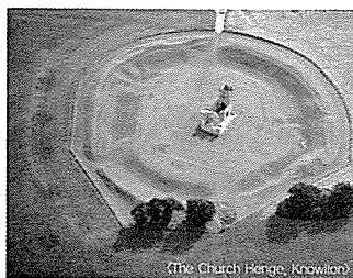
(The Church Henge, Knowlton)