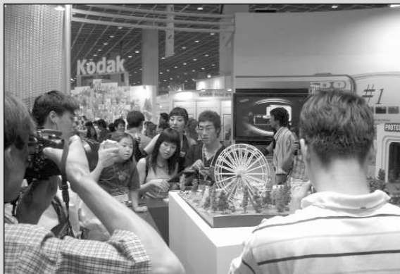
▶작년 전시회의 제품 체험관에서 카메라를 조작해보고 있는 관람객들의 모습