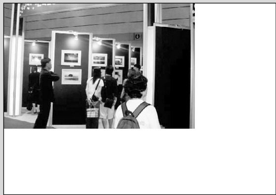
▶Photokina의 대표이사인 쿠르트씨가 올해 전시경향 및 주최측의 준비상황 등에 대해 설명하고 있다.

지 모든 과정을 보여주어 방문객들이 자신들의 경험과 연관시켜 전시관을 둘러볼 수 있는 구조를 제공한다"고 말했다. 또한 "Photokina 2006"은 이미징 분야의 국제적 하이라이트로 자리매김할 것으로 확신한다"고 강조했다.