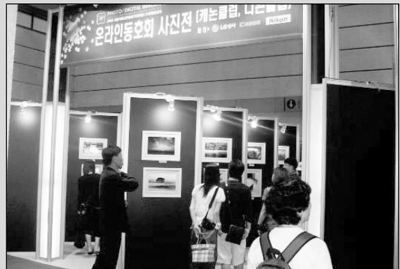
▶작년 전시회장 한쪽에 마련되었던 온라인동호회 사진전