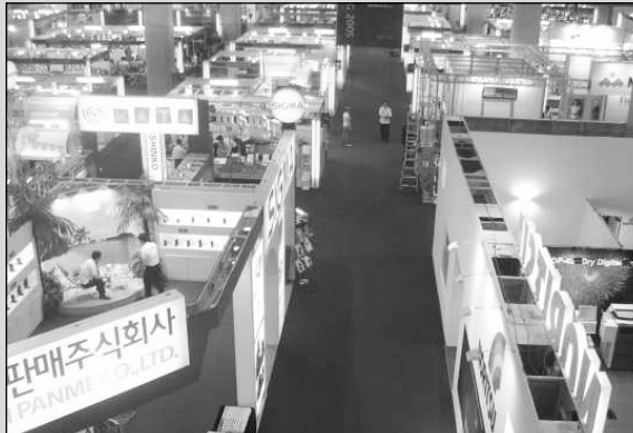
▶서울국제사진영상기자재전이 5월 18일부터 21일까지 4일간의 일정으로 서울 삼성동 코엑스 태평양홀에서 개최된다.

이미 아시아에서 수준높은 사진영상 관련 전시회로 자리매김을 한 본 행사를 국제적인 전시회로 성장시키기 위해 주최측은 많은 노력을 기울이고 있다. 그 일환으로 전 세계 160개국에서 엄선된 해외바이어를 대상으로 호텔숙박 지원과 'Asia-Pacific Competition', 'PPA & ASP Loan Collection', '옥동자' 정중철 사진전 및 촬영회, 핫셀클럽 제2회 회원사진전인 'The Second Step', 국내최초로 전시되는 임산부 사진전 등 국내외 다양한 사진전과 세미나 및 컨퍼런스 등의 부대행사를