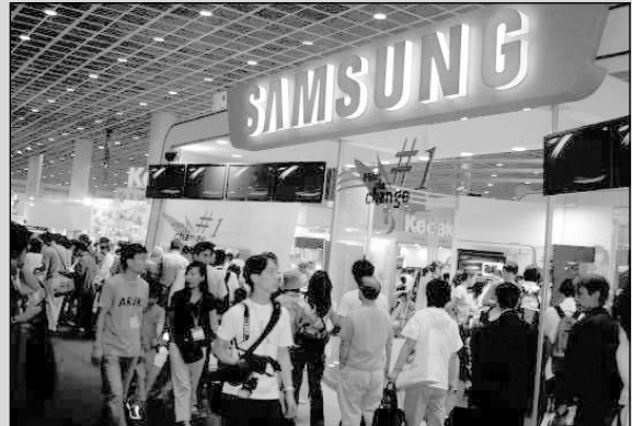
▶작년 전시회장 광경. 삼성테크윈 부스에는 연일 많은 관람객들의 행렬이 이어졌다.

준비했다. 'Asia-Pacific Competition'은 미국 PPA의 인터내셔널 프린트 컴퍼티션을 아시아 지역에서 개최하는 것으로 코엑스에서 직접 8명의 PPA 심사위원을 초빙하여 PPA 컴퍼티션 규정에 따라 작품을 개별 심사하여 점수를 부여하는 방식으로 진행 될 예정이며, 'PPA & ASP Loan Collection'은 '2006 PPA' 프린트 컴퍼티션에서 입선한 작품 가운데 우수작으로 뽑힌 작품들로 미국에서 직접 한국으로 가져와 전시하는 것으로 120년의 장구한 역사를 가진 PPA 회원들의 진수를 보여주는 수준 높은 전시가 될 것이다. 또한 핫셀클럽 제2회 회원사진전 'The Second Step'은 2003년 4월 출범하여 현재 5600여명의 회원이 소속된 국내 유일의 핫셀블라드 사용자 그룹인 핫셀클럽 회원들의 사진전으로 2005년 11월 제1회 'First Best Images전'에 이은 것이다.