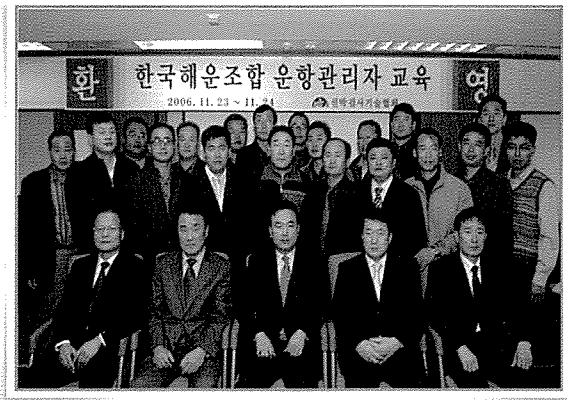
- 여객선 운항관리자 직무교육 실시 -

선박검사기술협회(이사장 김성규)는 지난 11월23일, 24일 양일간 협회 본부에서 한국해운조합 운항관리자와 여객선사 안전담당자 22명을 대상으로 안전운항 직무교육을 실시하였다.