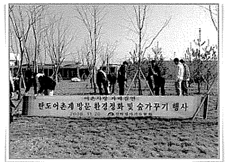
- 숲가꾸기 활동 장면 -

협회는 어촌사랑 자매결연 행사로 탄도어촌계를 방문하여 환경정화 및 숲가꾸기를 하였다.