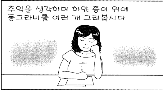
그림 이선영 / 글 곽성준