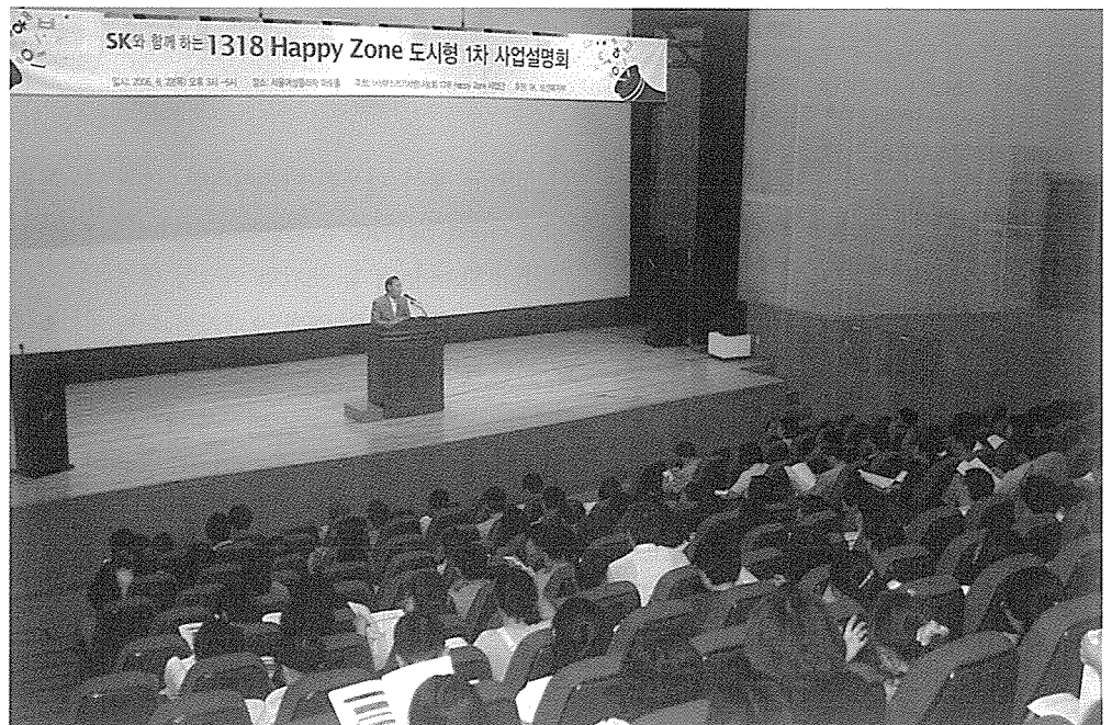
▲ 6월22일 열린 사업설명회는 아동·청소년 관련 단체의 많은 관심속에서 진행되었다

지원내용 : 지자체 공간 무료 사용, 시설 구축비, 운영비, 대학생 자원봉사자 및 멘토 연계, 문화관광부