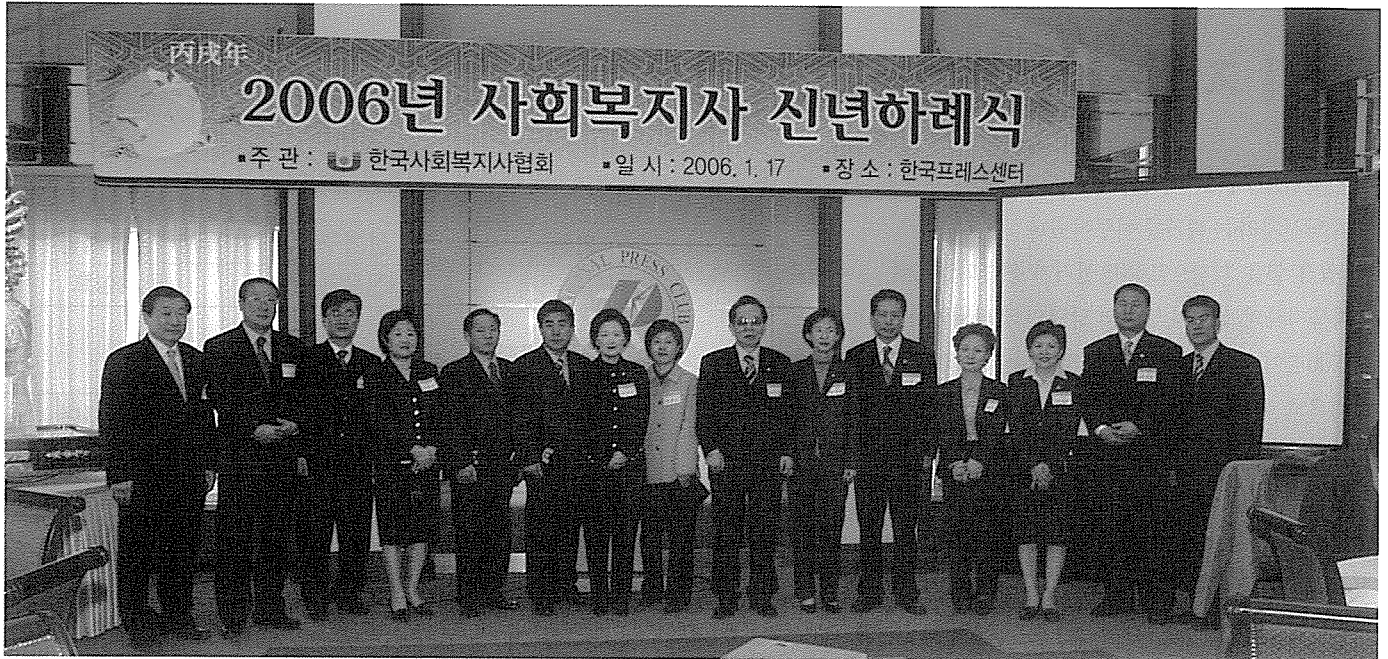
▲ 한국사회복지사협회는 신년하례식 뿐 아니라 사회복지사 대회 등을 통해 정치세력화를 위한 다양한 활동을 펼쳐왔다