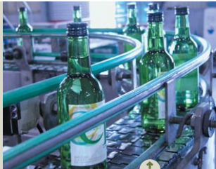
↑ 시원소주 생산라인