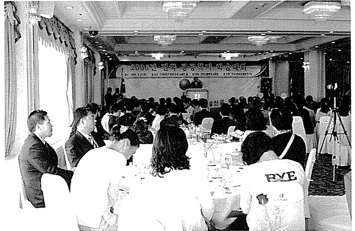
‘2006 전국 공공복지 학술대회’의 수상작은 다음과 같다.