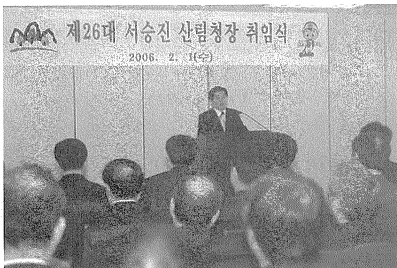
▲ 서승진 산림청장 취임식

2월 1일 제26대 산림청장으로 서승진 전 국립산림과학원장이 취임했다. 서승진 청장은 취임사에서 ‘국민의 기대에 부응하는 산림분야의 새로운 성장 동력을 찾기위해 국민, 임업인과 더불어 최선을 다할 것’ 이라고 밝혔다.