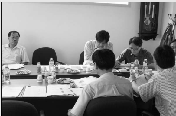
▶연구원들이 로드맵 품목군 분류에 대하여 다양한 의견을 교환하고 있다.