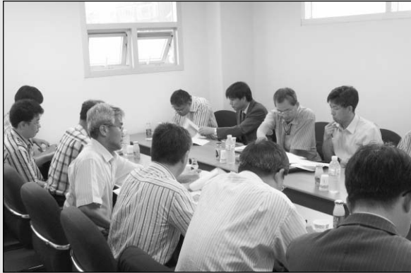
▶지난 7월 28일 한국광학기기협회에서 광학산업 로드맵 수립을 위한 제1차 분과위원회가 열렸다.

기협회를 주축으로 한 광학산업 로드맵 수립사업은 한국의 광학선진국 진입을 앞당겨 광학, 전자·기계, 컴퓨터, 정보통신 등 첨단IT산업의 핵심수출국가로 급부상 할 수 있는 밑바탕이 될 수 있다는 점에서 의미가 크다 하겠다.