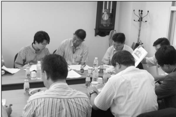
▶제1차 분과위원회에는 산학연 관련 18명의 위원들이 참석하여 폭넓은 의견을 나누었다.