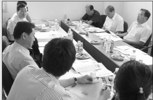
▶2006 산업기술로드맵 초정밀광학기기 분야에 대한 3차 전문위원회가 지난 8월 17일 한국광학기기협회에서 열렸다.