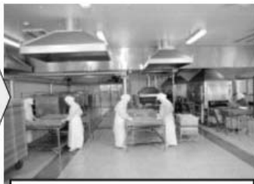
직화구이 / 찜 / 살기