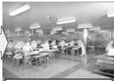
성형 / 슬라이스