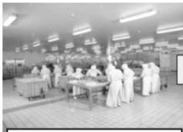
원료 전처리 및 만배할