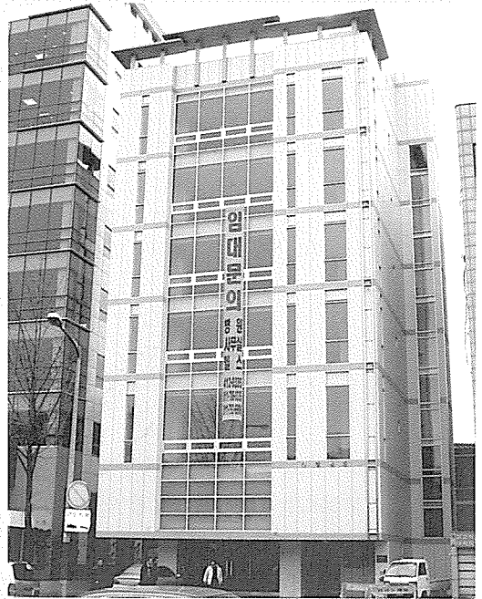
(주)송원의 외장재가 적용된 건물

또한 원판 가공 후에 도장을 통한 다양한 색상을 부여하게 되며, 고온 법랑도장의 경우 800℃ 이상의 온도에서 소성되어 고유가 시대에 에너지 효율성에 취약함을 보이며, 액체도장의 경우 유기용제를 사용하게 됨으로써 다량의 VOC물질이 발생