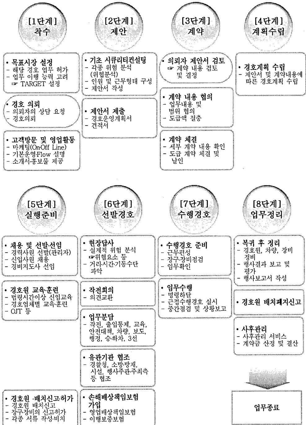
<그림2-1> 신변보호업무 운영 프로세스 모델