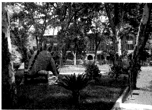
Fig. 2. The first research building and stegosaurus of NIGPAS.

많은 원로 연구원의 수가 96명이나 된다. 중건 연구원은 유럽과 미국에서 연구원으로 활동하면서 연구원과 협력하여 중국의 지질과 고생물에 대하여 연구하고 있다.