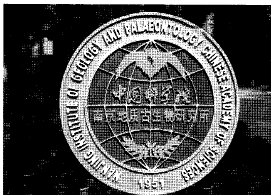
Fig. 1. Symbol mark of NIGPAS.