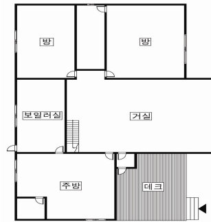
그림 3. 제 1 유형

울과 경기지방의 전원주택 41세대를 대상으로 평면분석을 실시한 김승범은 평면의 유형을 크게 4가지로 나누고 그중 가장 많은 수의 세대(15세대)가 포함된 1유형(그림 3)이 도시의 아파