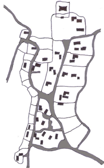
그림 1. 경북 달성군 묘동 농촌마을