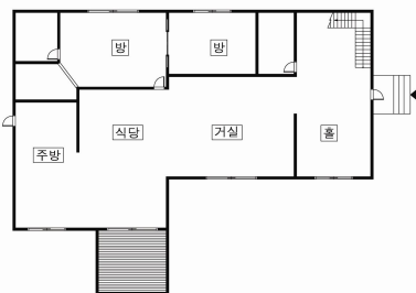
그림 4. 제 2 유형

트 평면과 유사한 유형이라고 밝히고 있다. 하지만 별도의 홀을 두고 거실이 독립된 2유형(12세대, 그림 4)도 현관에서 안방으로의 진입이