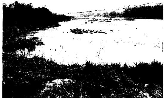
사진 6. 스위스 저수로 호안 철거를 통한 하안침식 허용 사례(스위스 투르강)