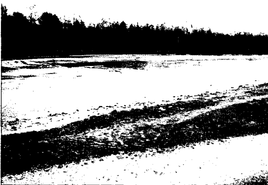
사진 5. 저수로 호안 철거 및 유사 인위적 투입을 통한 이동상을 확보한 사례(독일 이자르강)

일본의 경우, 1996년부터 기타가와(사진 7) 등 4개 실험하천을 대상으로 한 연구 성과를 도출하였다. 이