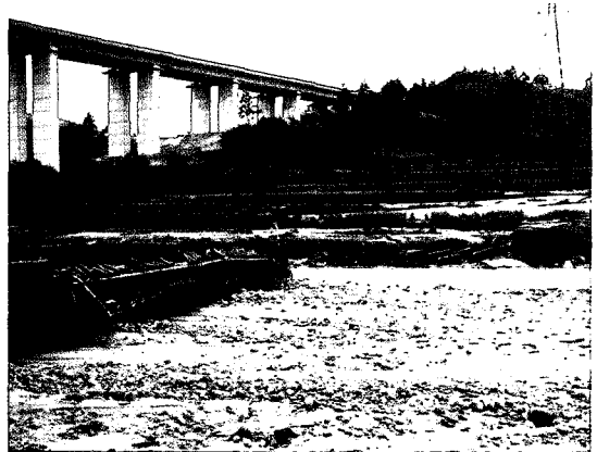
사진 2. 동해안 사천천의 토석류 발생 (태풍 루사, 2002)