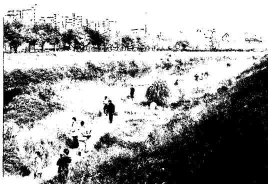
사진 8. 국내에서 하도변화를 반영한 첫 정비 사례 (학의천 학의공원구간)

가운데, 저수로 하안 침식이 허용되는 이동상 하도가 유지되는 하천정비 및 관리가 필요하다는 것이 주된 내용이다.