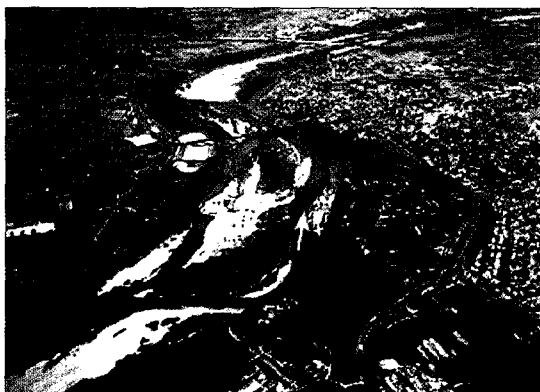
사진 7. 이렇사주 보전 등 이동상 하상을 보전을 위한 연구대상 하천(일본 기타가와)