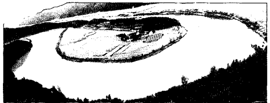
사진 3. 하도변화가 왕성한 자연하천(내성천 회룡포)