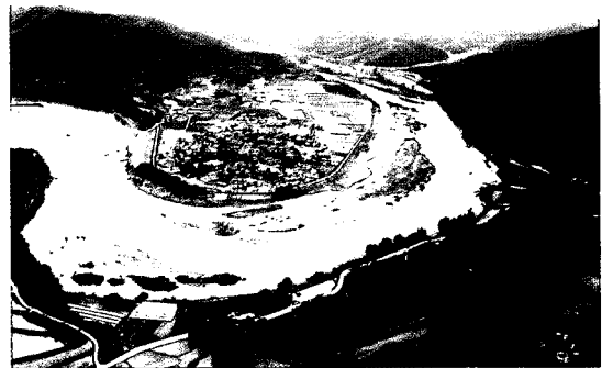
사진 1. 하회마을 백사장 쇠퇴와 하도내 식생 진입 (유영일, 2006)

진정한 하천의 모습은 유역과 하도내에서 일어나는 여러 자연적 인위적 환경에 따라 반응하면서 끊임 없이 변하는 것이 본질이고, 이는 고스란히 하천의