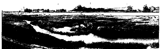
사진 4. 하도이동성이 멈춘 고정하상(문산천 옥석교)

하천의 모습은 유역과 하도내에서 일어나는 여러 자연적 인위적 환경에 따라 반응하면서 끊임없이 변화한다. 하도변화에 기여할 가능성이 있는 하도내 요인을 중심으로 개략적으로 살펴보면, a) 댐 축조 등 상류경계조건의 변화에 따른 홍수량과 토사공급의 감소, b) 이상 대홍수의 출현(사진 3) 혹은 홍수발생이 없는 기간이 어느 정도 계속되는 무홍수기간의 출현, c) 하상골재 채취 및 하천정비에 따른 하도굴삭, d) 지반침하, e) 이동성이 낮은 하상의 출현, f) 아마링(장갑화) 현상에 의한 표층하상재료의 고정화, g) 주로 wash load인 부유사의 하안부 퇴적, h) 큰 수위변동을 들 수 있다. 이들의 요인 가운데 a), b), c), d)는 외적으로 독립된 요인이며, e), f), g)는 a), b), c), d)에 의해 야기되어 나타나는 내재적 요인이다. 또한 a), c), d)는 인위적인 요인인 반면에 b)는 주로 자연적인 요인이다. 그리고, h)는 하상계수가 큰 하천에서 하구부를 제외한 곳 대부분에서 일어나는 요인으로 간주할 수 있다.